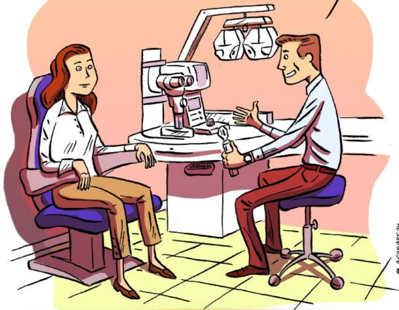
Illustration: M. Granger - Graphisme : GaspardPuisieux.com

JE VOUS ORIENTE VERS UN OPHTHALMOLOGISTE.